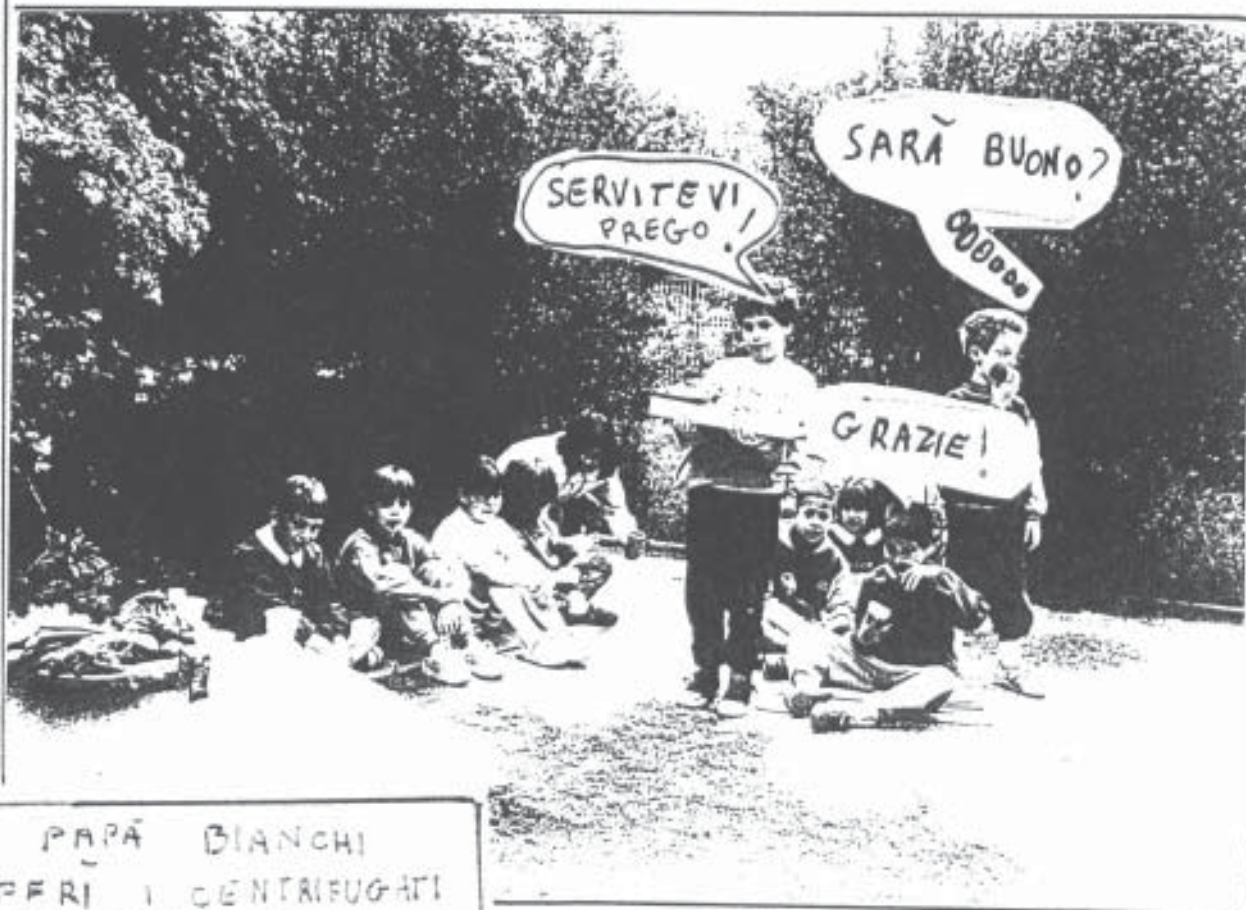
IL PAPÀ BIANCHI OPERI I CENTRIFUGATI ALLA FAMIGLIA ROSSI