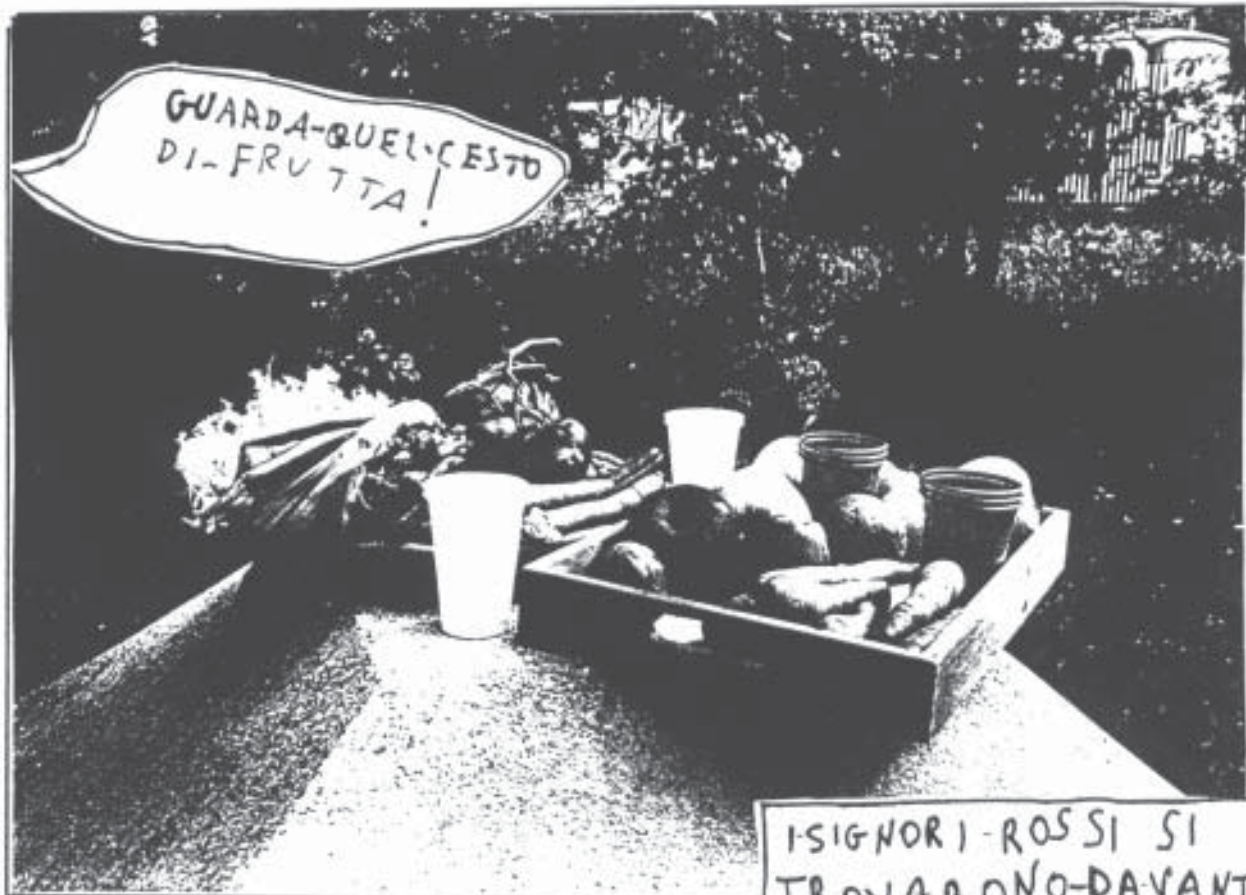
I-SIGNORI-ROSSI SI TROVARONO-DAVANTI UN-CESTO-DI-FRUTTA